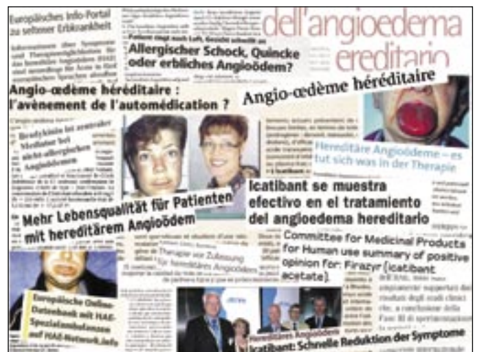
Europaweit wurden das Hereditäre Angioödem und die neue Therapieoption zum Thema für die Presse. Im Jahr 2008 gab es alleine in Deutschland knapp 70 Abdrucke.