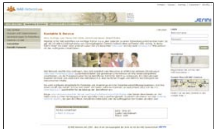
Die Plattform www.HAE-Network.info , die in Zusammenarbeit mit Therapiezentren und Patientenorganisationen entwickelt wurde, ist das Kernstück der Informationskampagne.

Alleine in Deutschland wurden 2008, also im Jahr des Launches, 68 Beiträge zur Erkrankung und der innovativen Therapie veröffentlicht - erfreulich viel Aufmerksamkeit für ein „Waisenkind“. <<